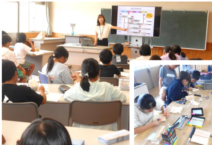
4年総合:防災学習をテーマに、インターネットや本で調べ学習をしたり、市役所地震防災課の方から学びを深めました。