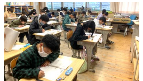
5年:自主学習ノートや授業態度の質が向上。最上級生に向けて前進中!