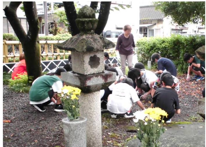
6年総合:グループに分かれ中村の町の過去・現在・未来を考える学習を展開。玉姫の日には有志が墓地を清掃。