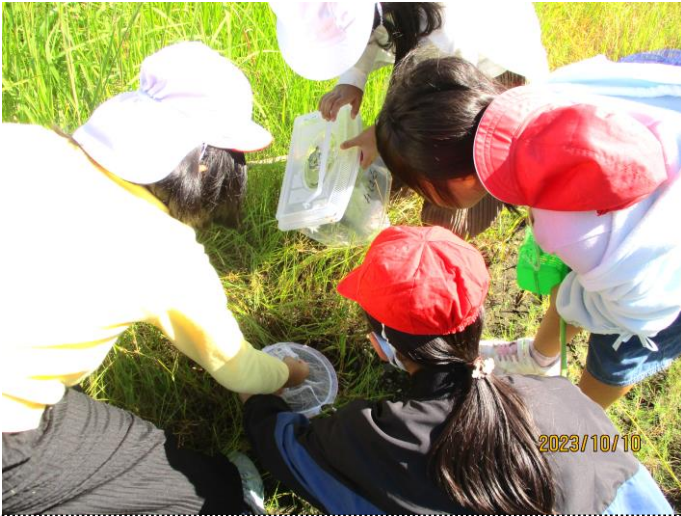
2年生活:後川堤防緑地で、子ども達はあみや虫かごを持って、いろいろな虫を探し、追いかけて、採集し、調べました。