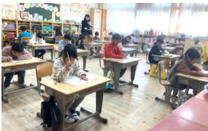
1年:初めての学力調査。両学級とも集中してよく頑張りました!

正確な結果が返ってくるのは、両学力調査とも2月末です。まとめの三学期は学力形成の大切な学期です。ぜひお子さんの勉強面の頑張りにも目を向け、励ましをお願いします。