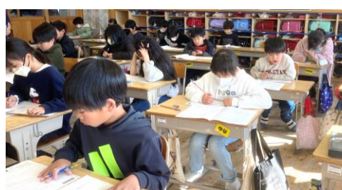
3年:“よく学びよく遊ぶ”授業中の集中度は上級生らしさも感じます。日々努力!