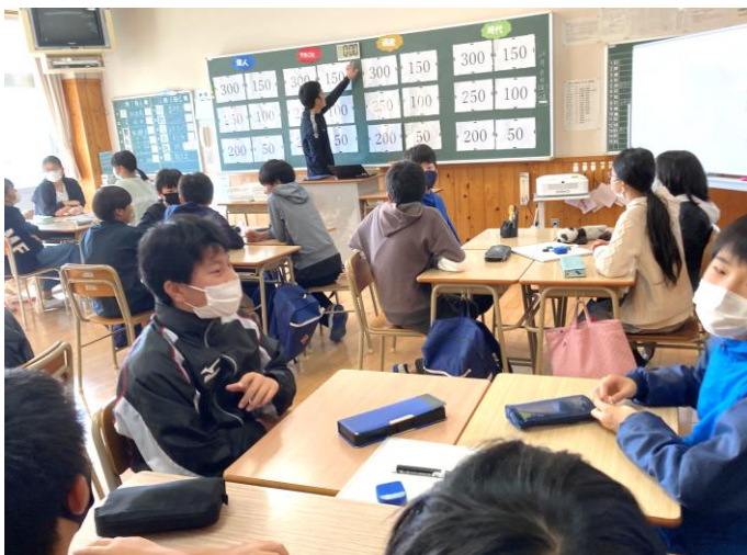
6年学級活動:市立中村中学校の体験入学。中学校の先生の授業や部活動を体験し中学校生活への展望を持ちました。