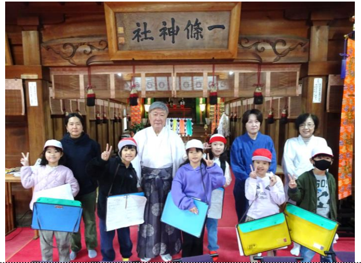
2年生活:1・2組混成グループを作って中村のまちを探検。商店街のお店、はれのぼ、一条神社でお世話になりました。